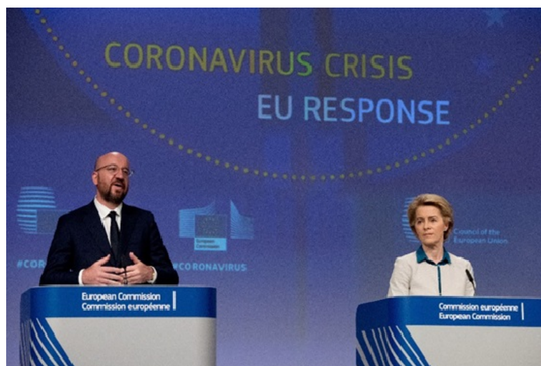
欧盟提出取消限制性措施路线图 强调相互协调循序渐进

元针对私人和公共部门的紧急资产购买计划，旨在应对疫情扩散给货币政策传导机制及欧元区带来的严重风险。欧央行还放宽了购买欧元区成员国国债的条件，在遵循各国央行出资比例的同时采取更灵活的