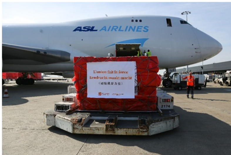
3月16日，中国阿里巴巴公益基金会和马云公益基金会提供的30万只口罩运抵比利时列日机场

在疫情呈现全球流行态势后，中方本着投桃报李、守望相助的精神，积极向包括欧洲国家在内的国际社会提供力所能及的物资帮助。据中方统计，截至4月中旬中国政府已向全球127个国家和4个国际组织提供包括医用口罩、防护服、检测试剂等在内的物资援助。 ① 中国各级地方政府、企业和民间团体也已向100多个国家和地区以及国际组织捐赠了医疗物资。在欧洲疫情暴发后，中方克服国内抗疫压力仍然巨大、复工复产、物资运输极为不便等多重困难，在第一时间向欧盟、意大利、西班牙、法国、德国、英国和塞尔维亚等欧洲国家提供了政府援助。除政府援助外，中方还根据欧洲国家的具体需求提供定向市场供应，如中方为西班牙的医疗物资需求提供专门的直供生产线；中法之间签署10亿支口罩的采购协议，为此两国将开辟“空中走廊”专门用于向法国空运这批急需物资。在地方层面，仅中国上海就向葡萄牙波尔图，德国汉堡，意大利米兰，意大利伦巴第、斯洛文