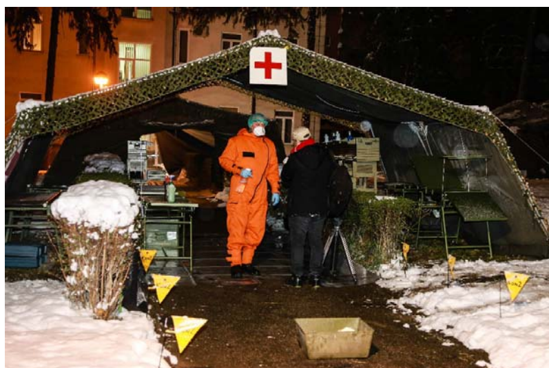
中国援助塞尔维亚抗疫医疗专家组驻地

国家与会官员和专家们感谢中方的经验分享，认为会议信息量大、专业性强，对指导正处于疫情快速发展中的中东欧国家做好防疫工作具有重要意义。 ① 3月19日，中国外交部会同国家卫生健康委举行中欧疫情防控工作视频会议，向英国、法国、德国、意大利、西班牙、瑞士等18个欧洲国家的政府官员和公共卫生专家介绍了中方防控工作经验。中方专家分别从新冠肺炎疫情的流行病学特征、防控策略、临床诊治等方面介绍了中方经验做法，并就外方提出的80多个问题进行了专业、细致的解答。欧洲国家与会官员和专家高度赞赏中国坚决有力防控举措，感谢中方及时举办此次会议，认为会议信息量大、专业性强，具备可操作性，对指导正处于疫情快速暴发期的欧洲各国做好防疫工作具有很好借鉴意义。中国和爱尔兰医疗专家也进行了跨洋连线，中方专家就爱尔兰同行提出的有关疫情防护、治疗等问题答疑解惑，并就预防社区传播、居家隔离政策、控制和切断传播途径、早期检测和干预、医疗资源统筹管理安排、大数据技术帮助等方面的经验进行了分享。中国政府还在线上开放英语版“应对新冠肺炎疫情中国经验知识库”，供包括欧洲国家在内的各国参考借鉴。除了远程经验交流外，自3月中旬后，中方应意大利、西班牙、英国、塞尔维亚等国请求派出医疗队，与欧洲同行在抗疫一线进行实地交