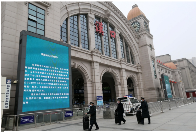
1月23日，武汉“封城”阻断病毒肺炎传播

中国抗疫的主要经验一是在疫情中心采取严格的封闭措施，尽力阻断疫情在全国范围内的大规模扩散和传播，同时在武汉、湖北和全