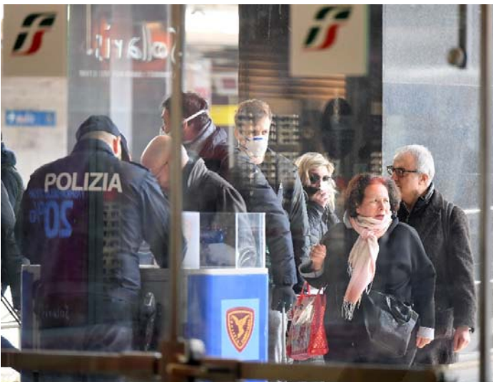
3月10日，意大利实施全国封城防止疫情扩散

意大利—西班牙的抗疫遭遇战。 最早成为欧洲疫情暴发点的意大利也是最早采取较严厉防控措施的欧洲国家。从2月7日发现首例当地人感染病例到2月22日确诊病例剧增前，意大利对于新冠疫情的认识局限于强流感应对方案，虽然有所行动但政策信号不够明确，防疫措施较为宽松，民众对病毒的认识也不足，许多大规模聚集活动照常举行。前期的认识不足和措施宽松，导致在2月22日疫情暴发后