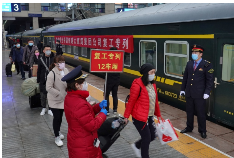
全国铁路开行务工专列保障复工复产

针对北京等人口流动性大的城市，按照“外防输入，内防扩散”的策略，压实属地、部门、单位和个人的责任，引导人员流动、严密管控通道、社区和口岸，坚决切断输入型传染源；针对湖北周边及