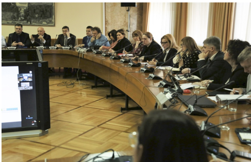
分享抗疫经验 赋予“17+1合作”新内涵 ——中国同中东欧国家举行疫情防控专家视频会议

唯有牢固树立人类命运共同体意识，全球同心抗击疫情，才能取得最终胜利。病毒不分国别，疫情跨越国界，是全人类面临的共同威胁。在全球化不断深化的今天，各扫自家门前雪、不管他人瓦上霜的