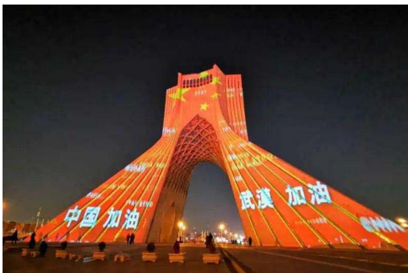
伊朗自由塔点亮中国红为中国抗疫加油

与此同时，世界各地还通过各种形式声援中国防疫。澳大利亚、日本、伊朗、阿联酋、以色列等多国纷纷在其地标性建筑物上点亮“中国红”，为中国的疫情防控工作鼓劲加油。泰国、俄罗斯、巴西、意大利、德国等多个国家的各界人士制作暖心视频，表达对中国人民抗击疫情的支持。