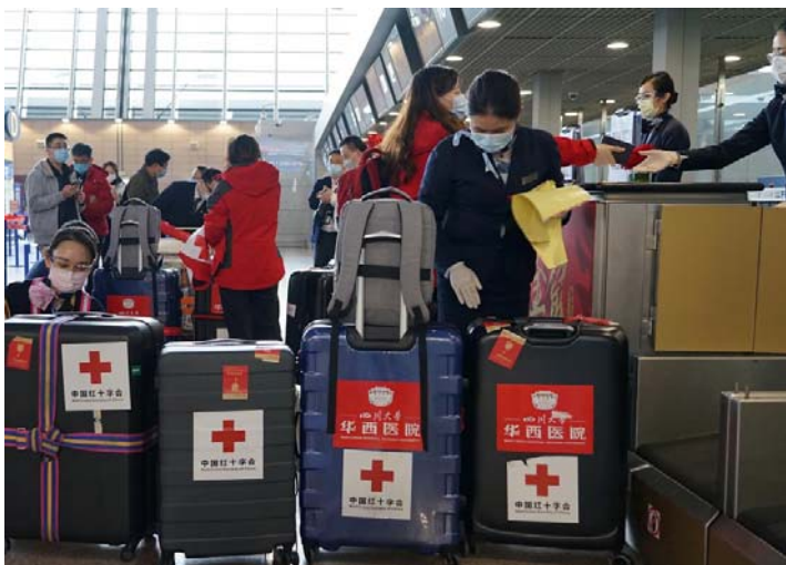
东航执行中国首班援外防疫专家组包机 9名“逆行者”和抗疫物资飞往罗马

提供必要援助，展现大国风范。当前，我国抗击疫情的斗争正处在最关键阶段，不少国家也正面临疫情的考验。3月11日，世卫组织总干事谭德塞说，“新冠肺炎疫情从特征上可称为大流行” ② 。疫情无国界，联防联控是全球化背景下各国应对传染病疫情的必然要求。处在抗疫一线的中国明确表态，愿意向相关国家提供力所能及的帮助和支持，发挥我负责任大国作用。目前，我国已向日本、韩国等多国提供医疗物资支援，并派出医疗专家组奔赴伊朗、意大利等国，分享抗疫经验，加强医疗合作。