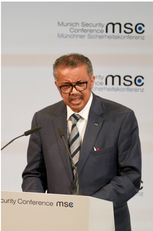
世卫总干事： 中国为全球应对疫情赢得时间

艰苦卓绝的努力展现大国担当，创造了世界防疫史上的诸多奇迹，为全球抗疫做出重大贡献，赢得国际社会的认可和肯定。