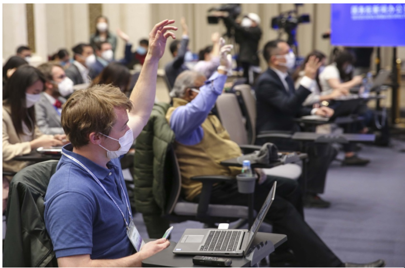
国新办举行援助湖北医疗队专家介绍新冠肺炎重症科学救治记者见面会

中国向世界公开研究成果和相关做法，在全球多国面临疫情国际扩散的当口，对世界各国携手抗疫提供公共产品，做出了重要贡献。中国科学界身处“战疫”最前线，相关科研工作