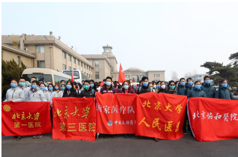
1月26日，国家援鄂抗疫医疗队队员启程援鄂

统筹联防联控，确保基础供应。疫情发生后，根据习近平总书记的重要指示精神和李克强总理的批示要求，国务院联防联控机制统筹疫情防控、医疗救治、科研攻关、宣传、外事、后勤保障和前方工作，对新型冠状病毒感染的肺炎疫情防控