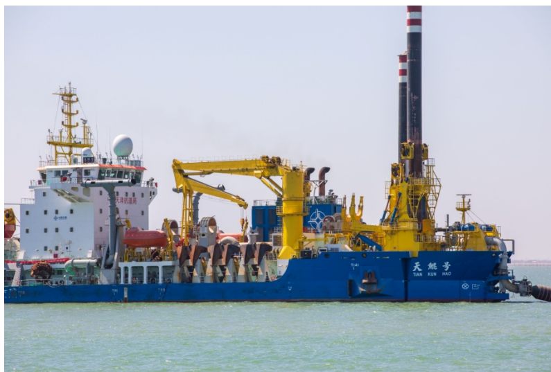
连云港赣榆港区 10 万吨级航道 延伸段工程全面复工复产

“全国规模以上工业企业复工率逐步提高，截至 3 月 2 日，上海、浙江、贵州、安徽、江苏、重庆等地规模以上工业企业复工率超过 90%。” ② 以上海市为例，截至 2 月 29 日，“该市规模以上工业企业复工